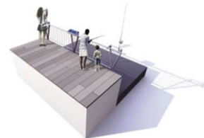
PASEO NUEVAS BARANDILLAS