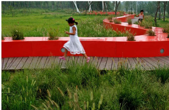
Tanghe River Park in Qinhuangdao