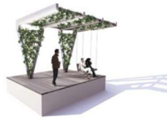
PASEO SOMBRA CON PERGOLAS

El número de estas soluciones constructivas será reducido: un único tipo de pavimento duro para las aceras en el Nivel Urbano, una solución para el carril bici cuando este sea exclusivo (en el Nivel Urbano), un pavimento blando en el Corredor Verde, otro diferenciado para las sendas en altura y opcionalmente otro para las escaleras y rampas.