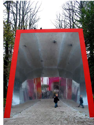
Pasarela cubierta en el Parque Nacional (Holanda). Pavimento blando.