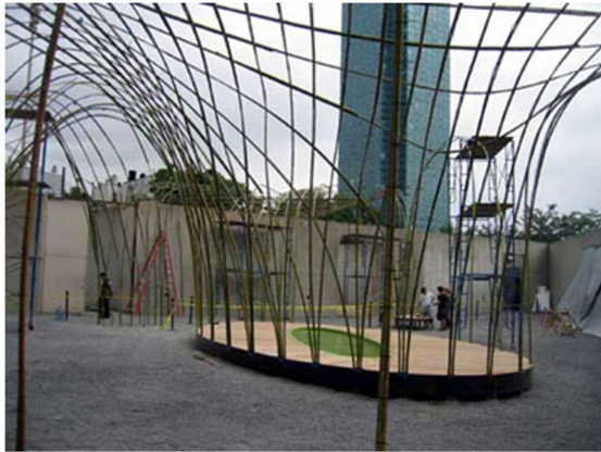
Instalación temporal en el Museo PS1 Kroller-Muller (Nueva York, verano 2006)

A nivel Urbano se buscará un surtido de soluciones que creen lugares habitables y humanizados como: parterres arbolados, bancos y mesas, pérgolas, alumbrado, además de una solución de barandilla unificada en todo el recorrido.