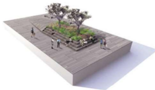
PASEO PLATAFORMA CON BANCOS Y ARBOLADA