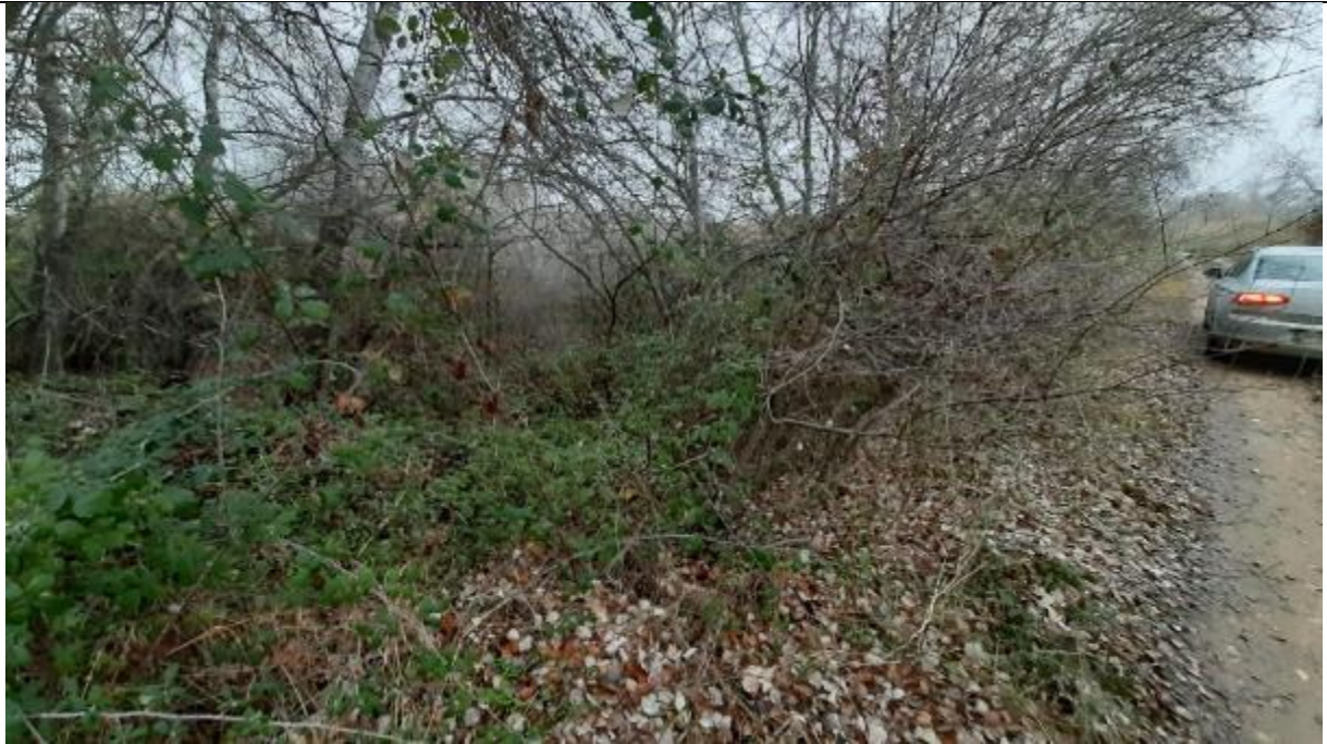
Fotografía 5 Zona yerma entre la mota actual y la propuesta (Término municipal de El Burgo de Ebro)