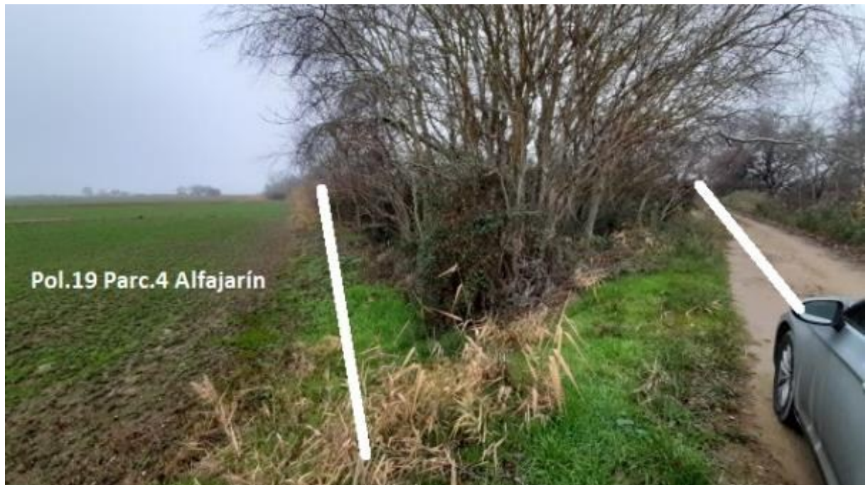
Fotografía 2 Mota actual y nuevo trazado propuesto