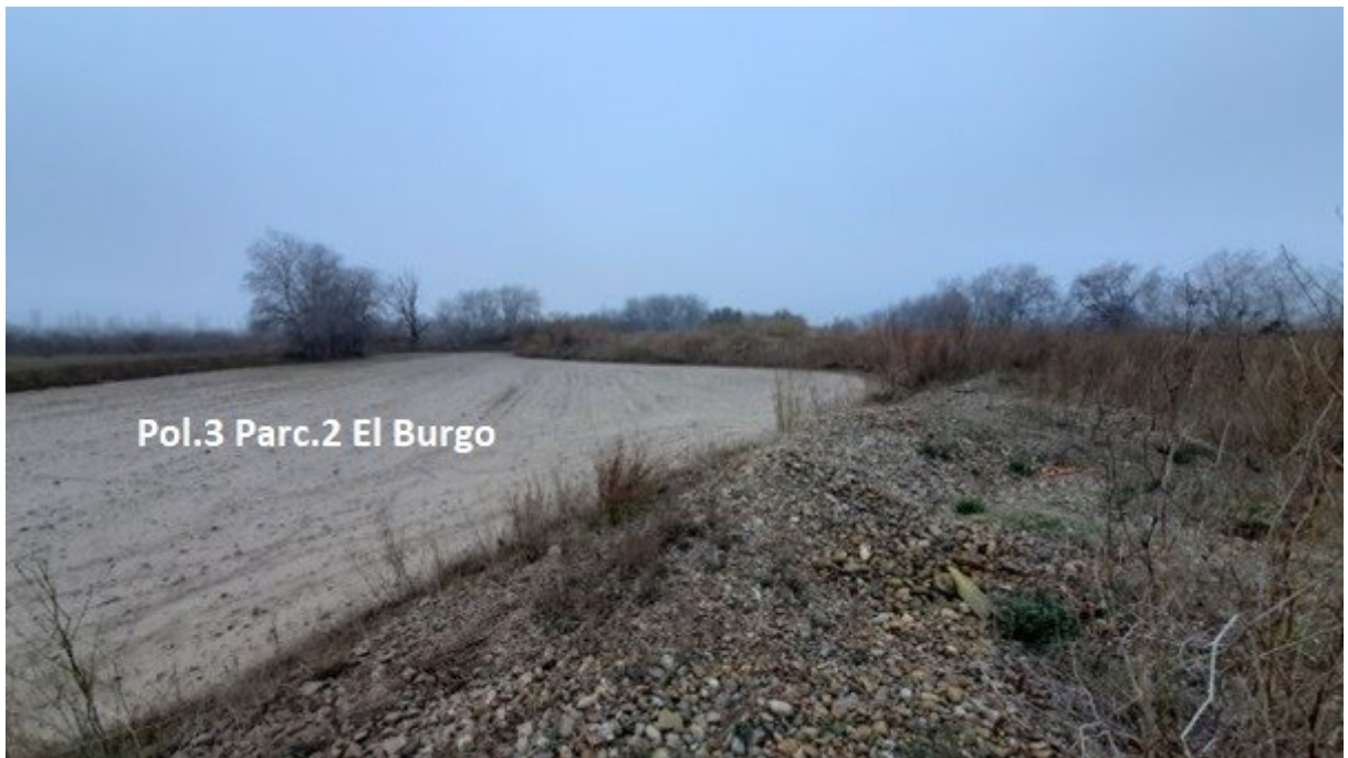
Fotografía 6 Estado de la mota actual al inicio del cauce de alivio propuesto