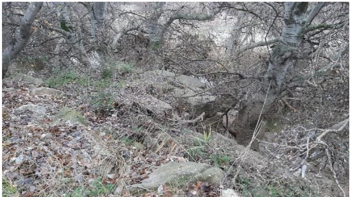
Fotografía 4 Detalle de la defensa transversal al río en la mota actual