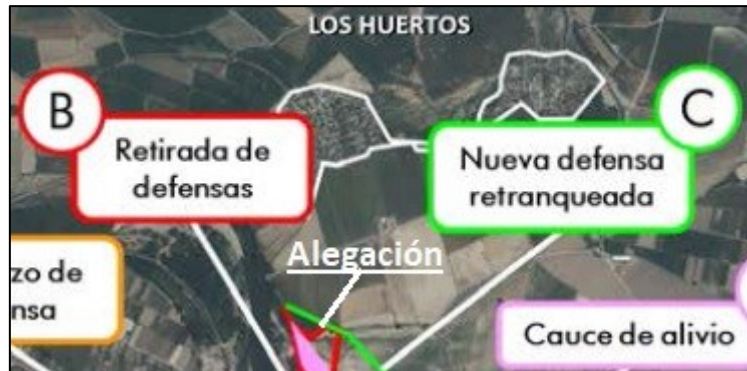
Figura 2 Detalle de la ubicación de la zona de alegación

En líneas generales estamos de acuerdo en las actuaciones B, C y D señaladas, pero yendo más al detalle nos preocupa el trazado marcado para la nueva defensa retranqueada en su inicio aguas arriba y que se señala en la Figura 2.