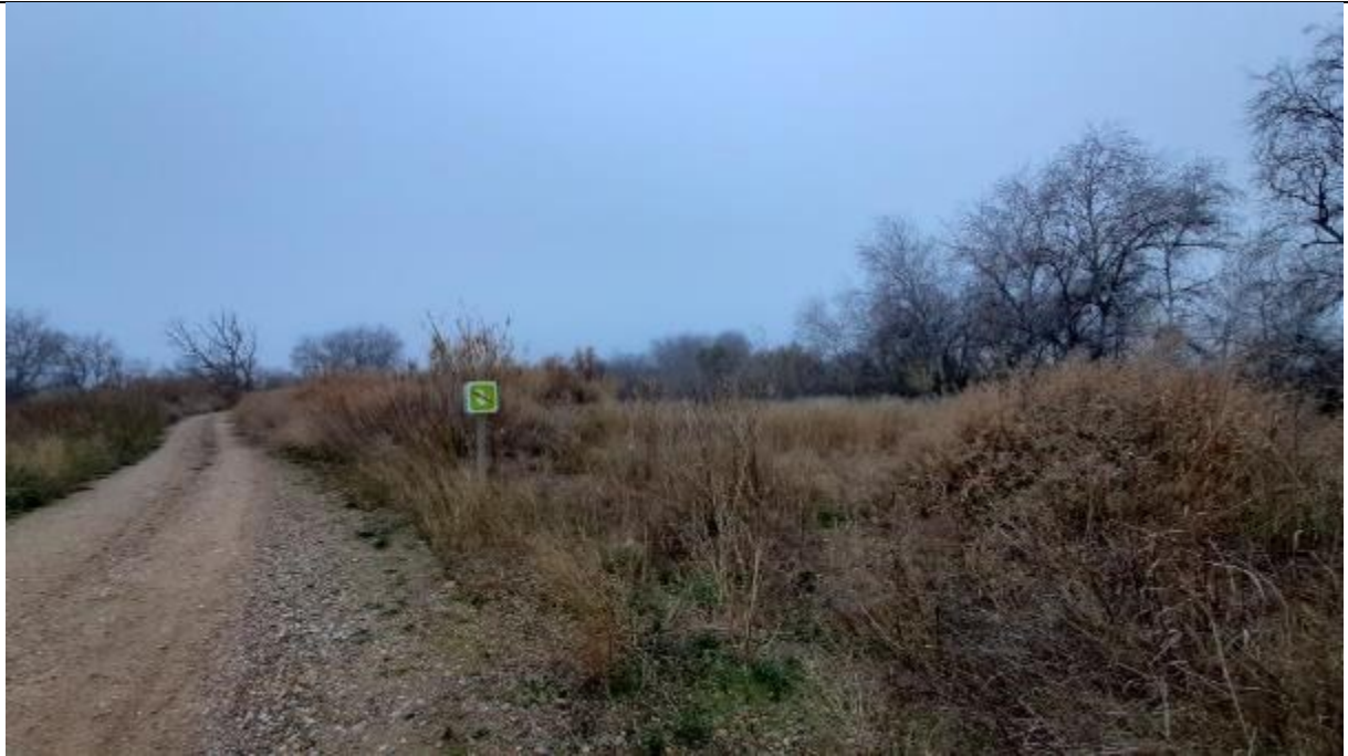
Fotografía 7 Detalle del estado de la mota actual al inicio del cauce de alivio propuesto

Por lo indicado solicitamos que, para seguir ejerciendo su fundamental papel de protección ante avenidas y para la estabilidad del extremo noroeste del cauce de alivio que se pretende habilitar, se mantenga el actual trazado de la mota. También sería aconsejable que se mantuviera constante la cota de la defensa actual y retranqueada desde el punto 1 hasta el 3 de la Figura 3.