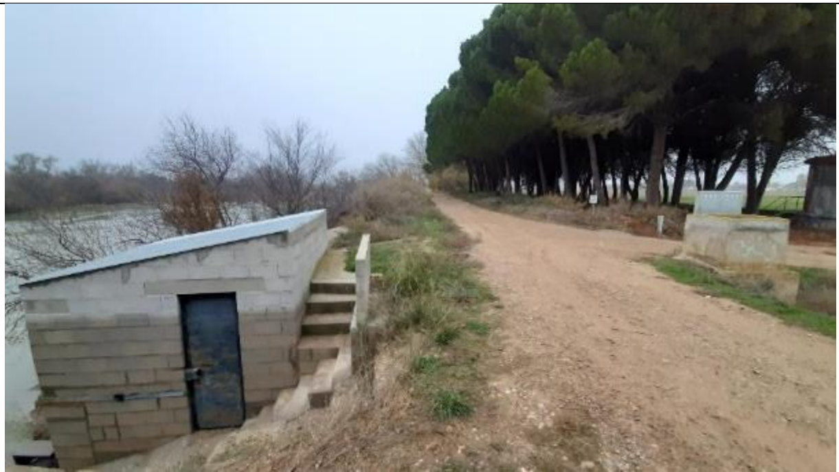
Fotografía 1 Defensa actual en la zona de la caseta de bombas de la finca (Punto 1 de la Figura 3)