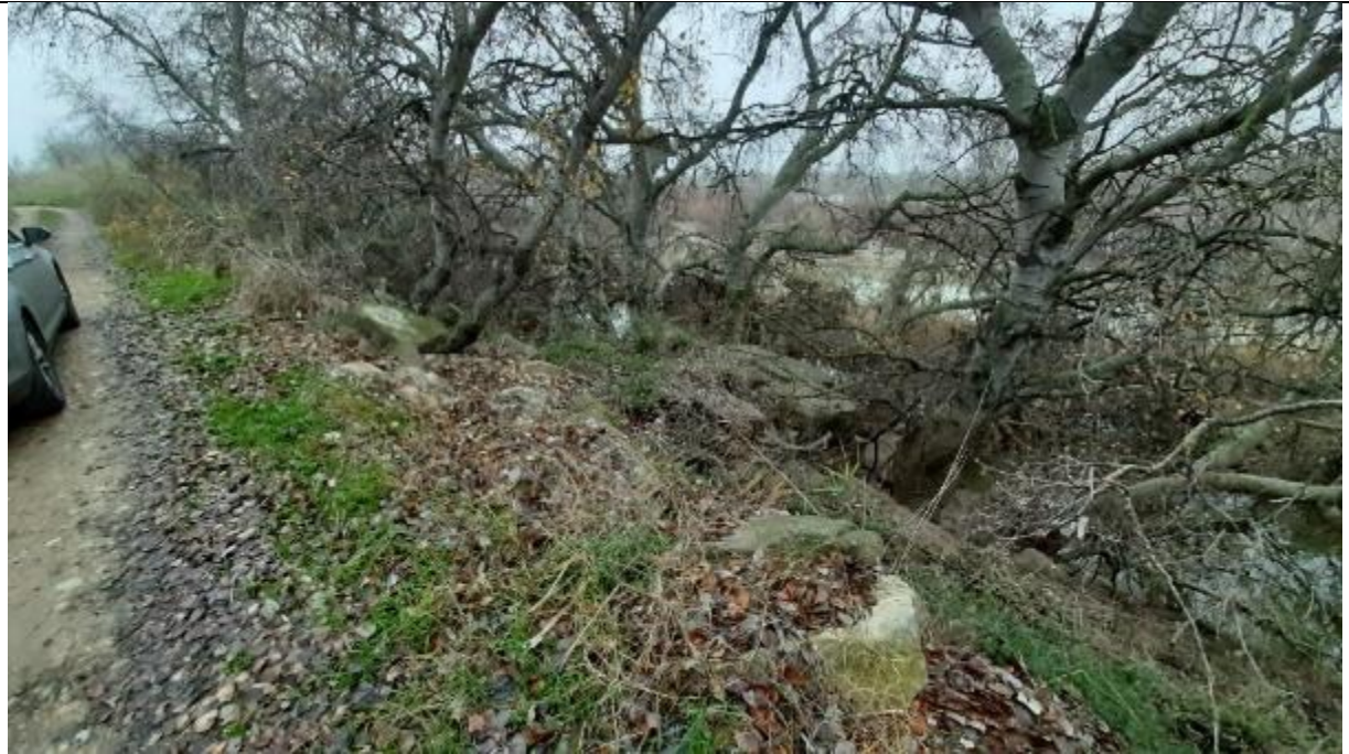
Fotografía 3 Estado de la mota actual y defensa