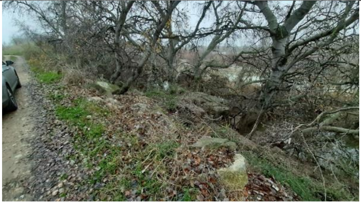
Fotografía 3 Estado de la mota actual y defensa