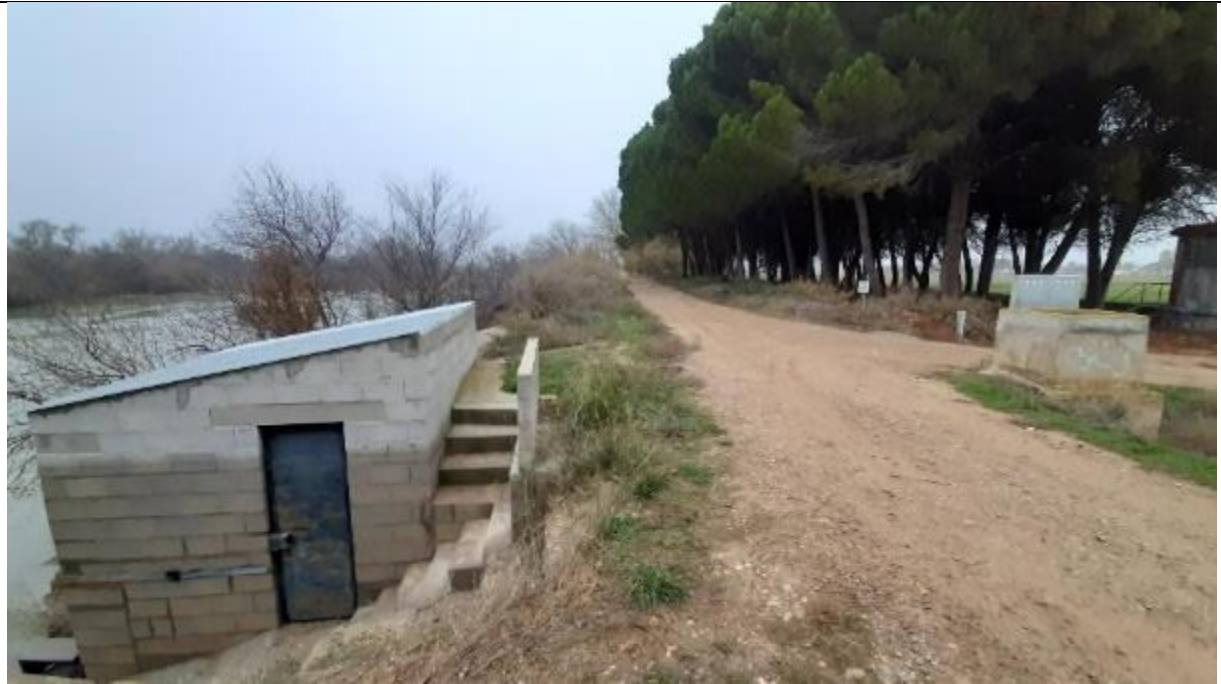
Fotografía 1 Defensa actual en la zona de la caseta de bombas de la finca (Punto 1 de la Figura 3)