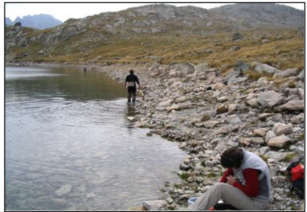
Vista de la zona litoral del lago en el punto de muestreo