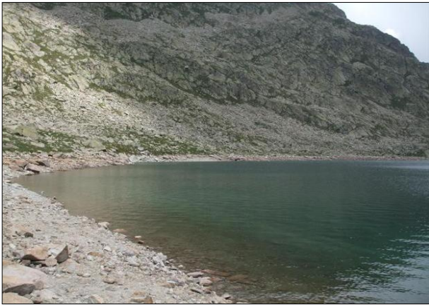
Vista de la zona litoral del lago