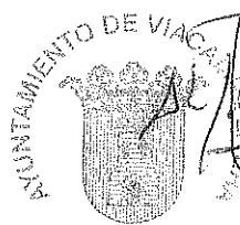
Alfredo Pociello Colomina