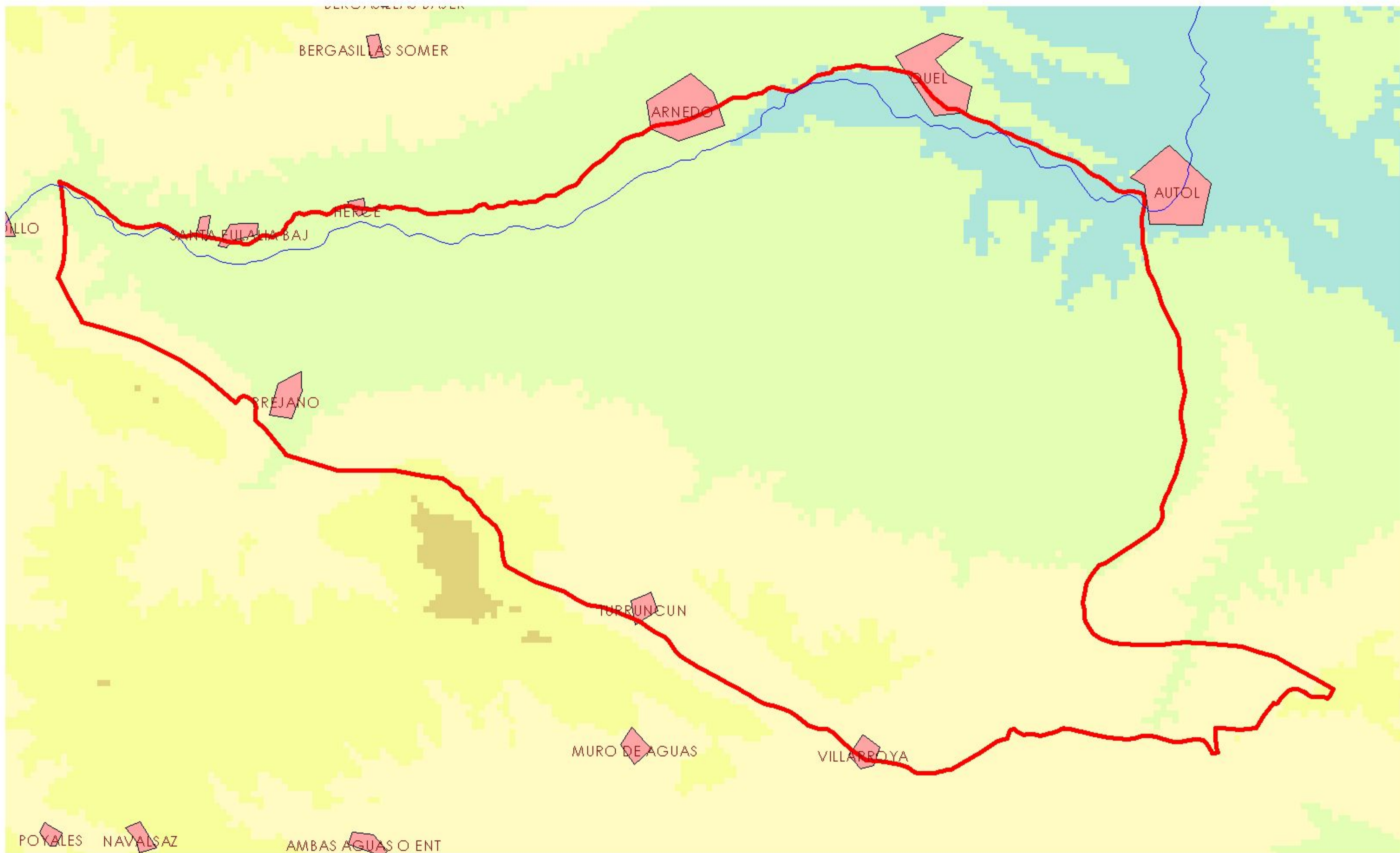
MAPA 1.2: MAPA DIGITAL DE ELEVACIONES 90_067 DETRÍTICO DE ARNEDO