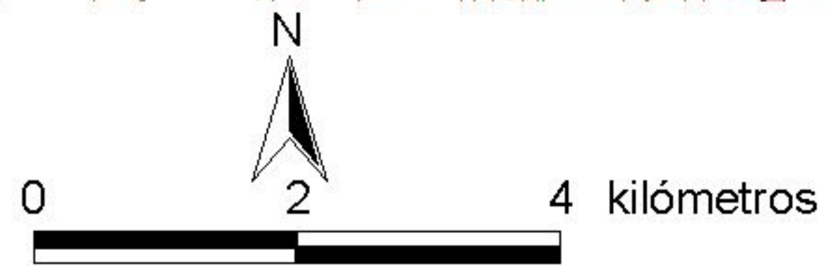
MAPA 1.1: MAPA DE IDENTIFICACIÓN 90_067 DETRÍTICO DE ARNEDO