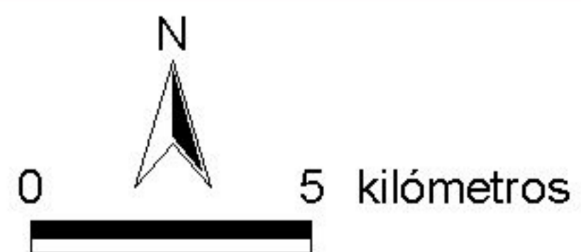
MAPA 1.2: MAPA DIGITAL DE ELEVACIONES 90_053 ARBAS